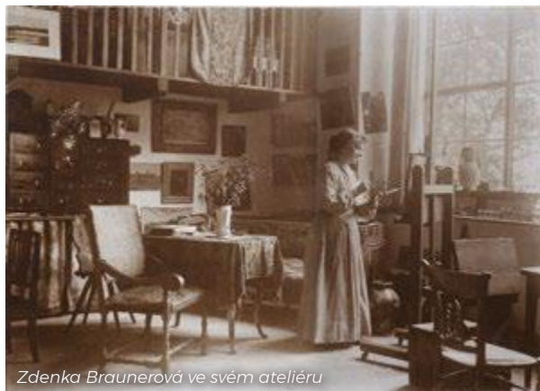
Zdenka Braunerová ve svém ateliéru

První žena 19. století, která odmítla roli ženy pouze jako dobré matky a manželky, a namísto toho se pustila do kariéry výtvarné umělkyně. Ač okouzila řadu zajímavých mužů a prožila několik lásek, tu pravou nikdy nenašla.