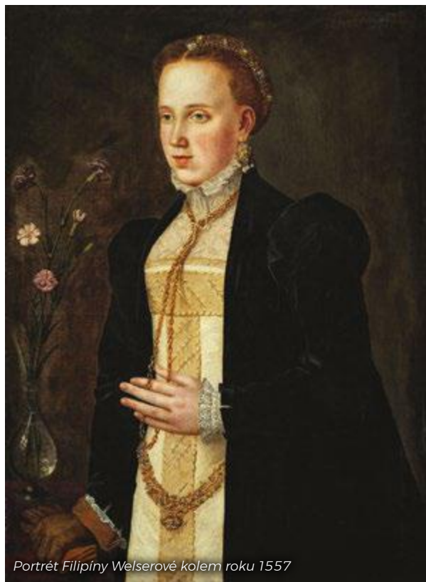
Portrét Filipíny Welserové kolem roku 1557

Nerovné manželství bylo uznáno pouhé čtyři roky před smrtí Filipíny, kdy jej posvětil papež. Tou dobou žili manželé na zámku Ambras u Innsbrucku. Ferdinandova právoplatně uznaná manželka zemřela s pohledem na milovaného muže se slovy: „Vidím, co mě těší! Navzdory četným protivenstvím bylo manželství – dcery obchodníka a potomka císaře – jedno z nejšťastnějších v historii habsburského rodu.“