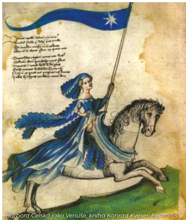
Barbora Celská jako Venuše, kniha Konrád Kyeser, Bellifortis

Barbora Celská zemřela ve svém sídle na Mělníku během morové epidemie v roce 1451. Císařovna, uherská a česká královna byla pohřbena v pražské katedrále sv. Víta.