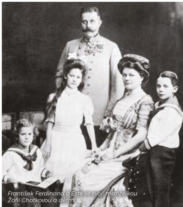
František Ferdinand d'Este se svojí manželkou Žofií Chotkovou a dětmi

Na přelomu 19. a 20. století bylo uzavření sňatku právem jen pro „vyvolené“. Právě proto životní příběh české šlechtičny Žofie Chotkové (1868-1914) a následníka rakousko-uherského trůnu Františka Ferdinanda d'Este (1863-1914) překonal veškerá tehdejší tabu.