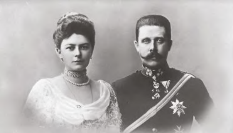
Fotografie na protější straně: Portrét Františka Ferdinanda a Žofie Chotkové Antonín Dvořák s chotí Annou Svatba Karla I. a Zity za účasti císaře Františka Josefa I. Karel Čapek s prezidentem T. G. Masarykem