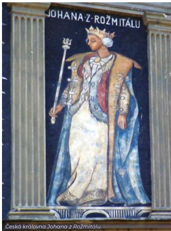
Česká královna Johana z Rožmitálu

Až do posledních let svého života žil Jiří svým velkým snem. Počítal s tím, že založí „poděbradskou dynastii“ a pokusí se ji u českých stavů prosadit. K tomu mu ale scházel syn, narozený v době, kdy už byl Jiří králem. A přitom měl Jiří tolik dětí – k šestici z prvního manželství mu jich přibylo pět dalších. Velké naděje tak oba vkládali alespoň do svého prvorozeného syna