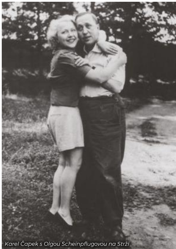
Karel Čapek s Olgou Scheinpflugovou na Strži

V okamžiku jejich setkání dělil Karel Čapek své srdce mezi exotickou Věru Hružovou a drobnější