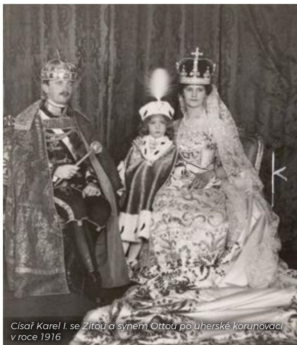
Císař Karel I. se Zitou a synem Ottou po uherské korunovaci v roce 1916

O několik let později se ve Františkových Lázních setkal s atraktivní Zitou. Štíhlá mladá žena, s vlasy vyčesanými do drdolu, byla pro svůj půvab srovnávána s císařovnou Alžbětou. Karel, druhý na postu následníka rakousko-uherského trůnu, byl nucen do sňatku a Zita měla vhodný královský původ. Ovšem její city se rozvíjely následující dva roky, než ji Karel požádal o ruku. Na zasnubní fotografii připsala Zita své